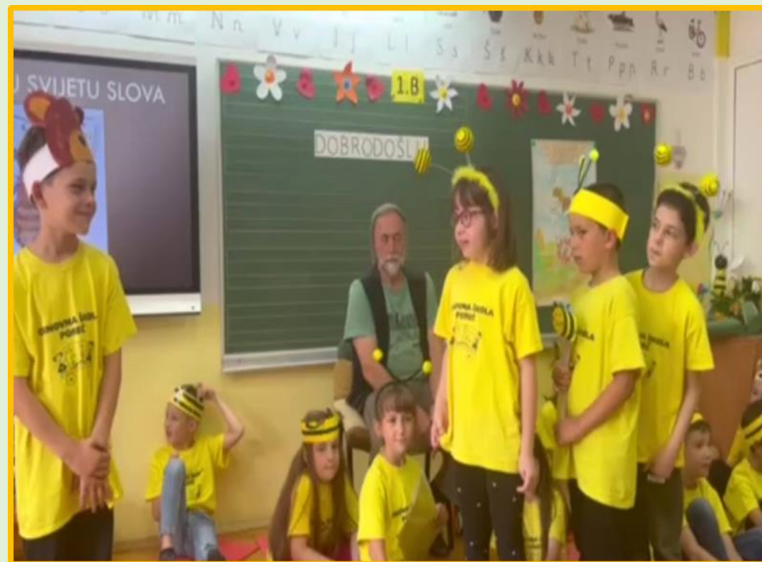
Recitiramo, pjevamo i glumimo o pčelici