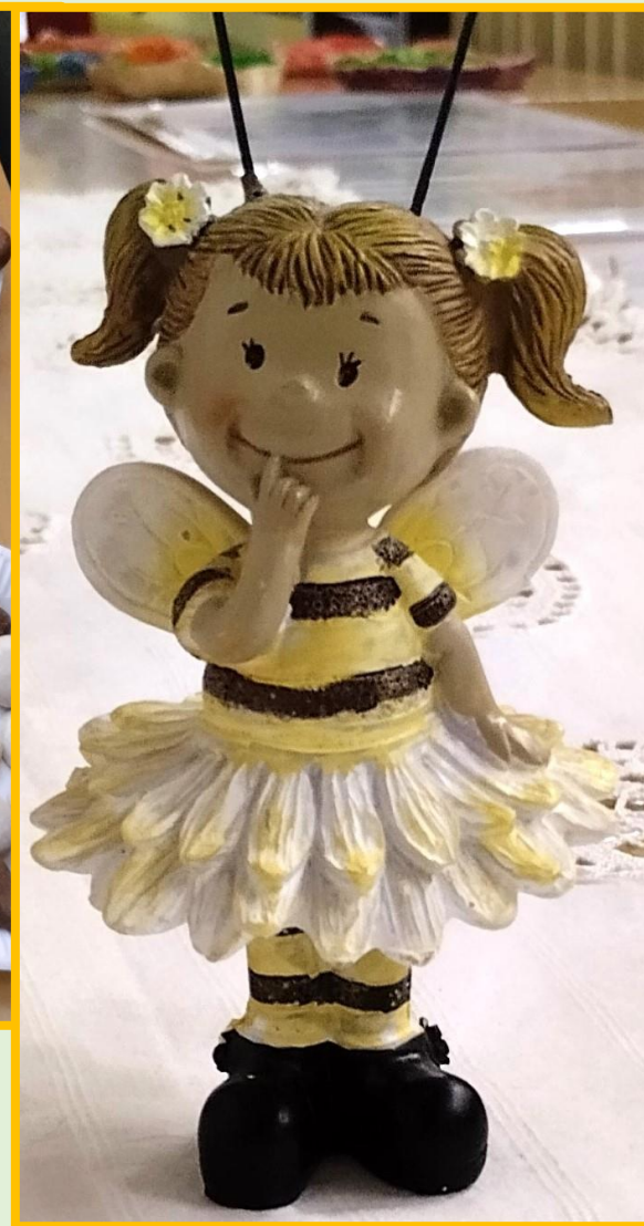
Slatko iznenađenje - medenjaci