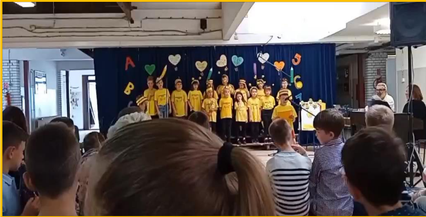
Slijedi predstavljanje razrednog projekta Pčelice u svijetu slova u učionici 1. b razreda.