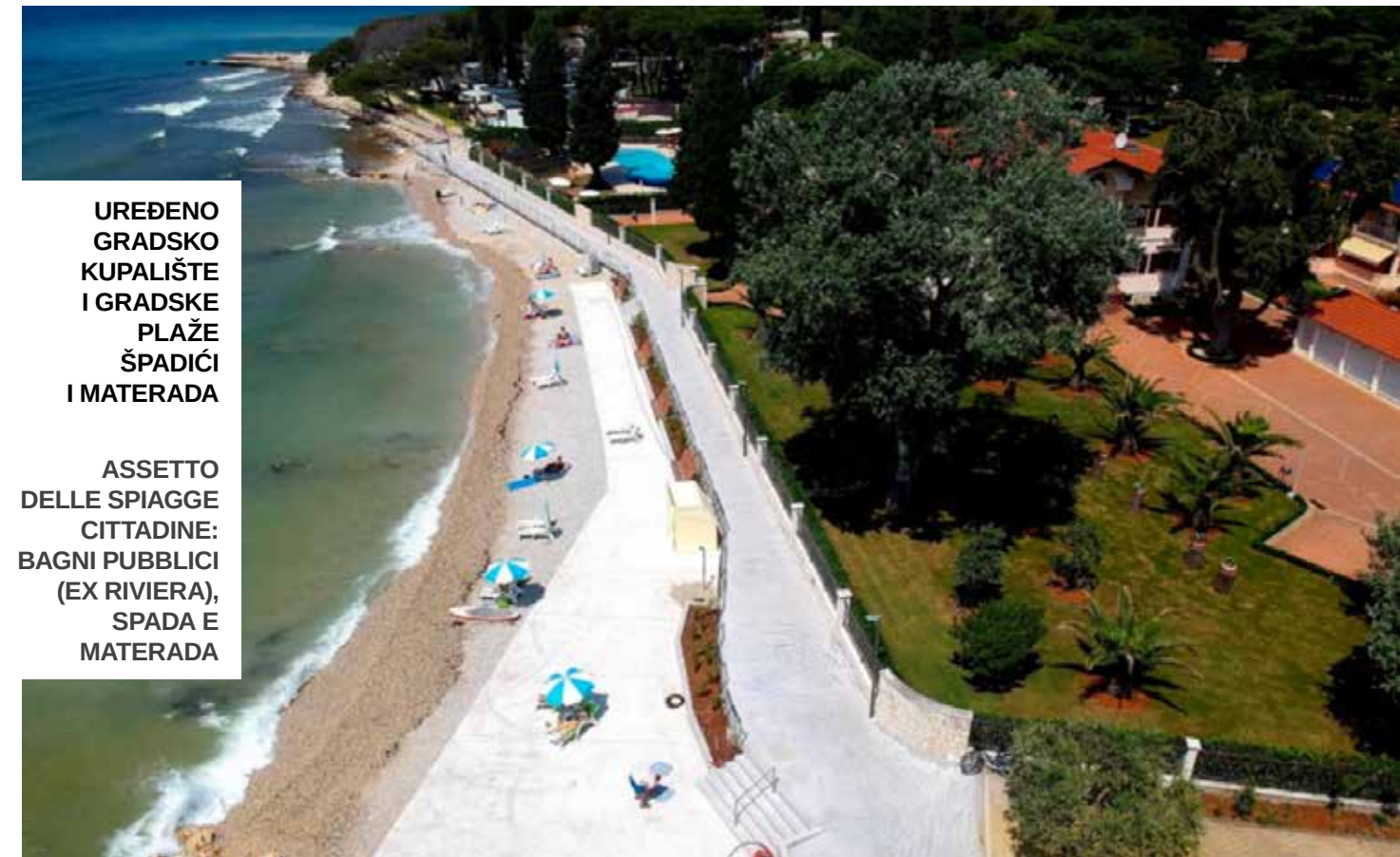
UREĐENO GRADSKO KUPALIŠTE I GRADSKE PLAŽE ŠPADIĆI I MATERADA