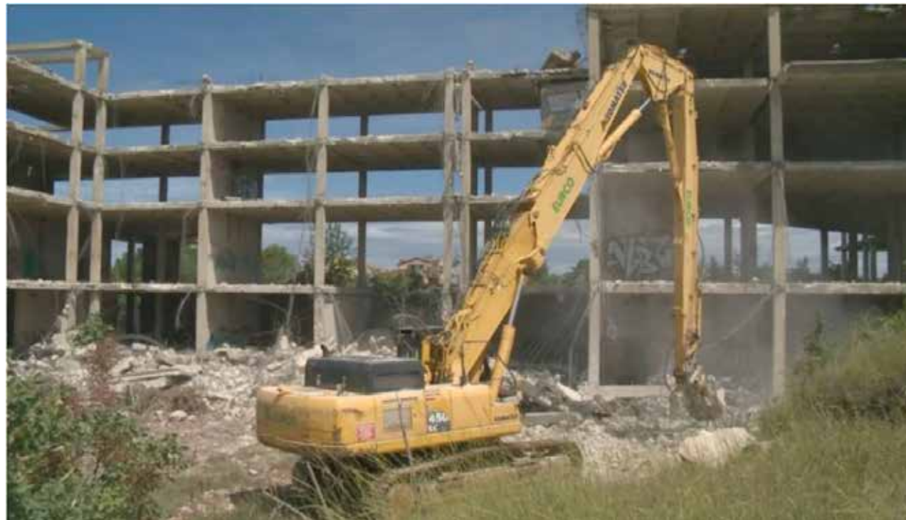
GRAZIE ALLA COLLABORAZIONE CON I CITTADINI ED I PROPRIETARI, RIMOSI GLI IMMOBILI FATISCENTI „SERVO MIHALJ“ E L' ALBERGO „MARINA“ A PORTO CERVERA