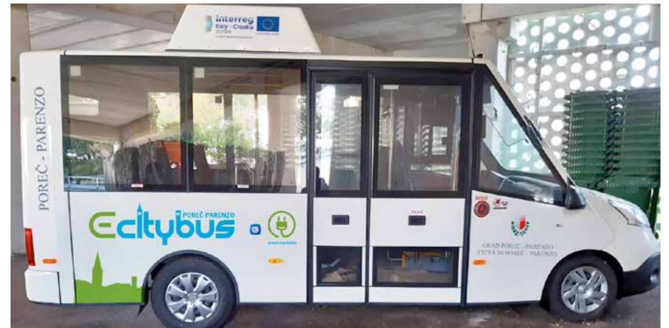
NABAVLJEN ELEKTRO-BUS ZA PILOT PROJEKT JAVNOG PRIJEVOZA BUS ELETTRICO PER IL PROGETTO PILOTA DI TRASPORTO PUBBLICO

POSA DI PIU' DI 1650 LAMPADINE LED CON IL RISPARMIO ENERGETICO DEL 76%; ILLUMINAZIONE DELLA CIRCONVALLAZIONE