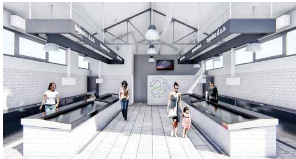
ODOBRI EU NOVCI ZA CENTAR ZA POSLJETITELJE LA MULA DE PARENZO I OBNOVU GRADSKJE RIBARNICE