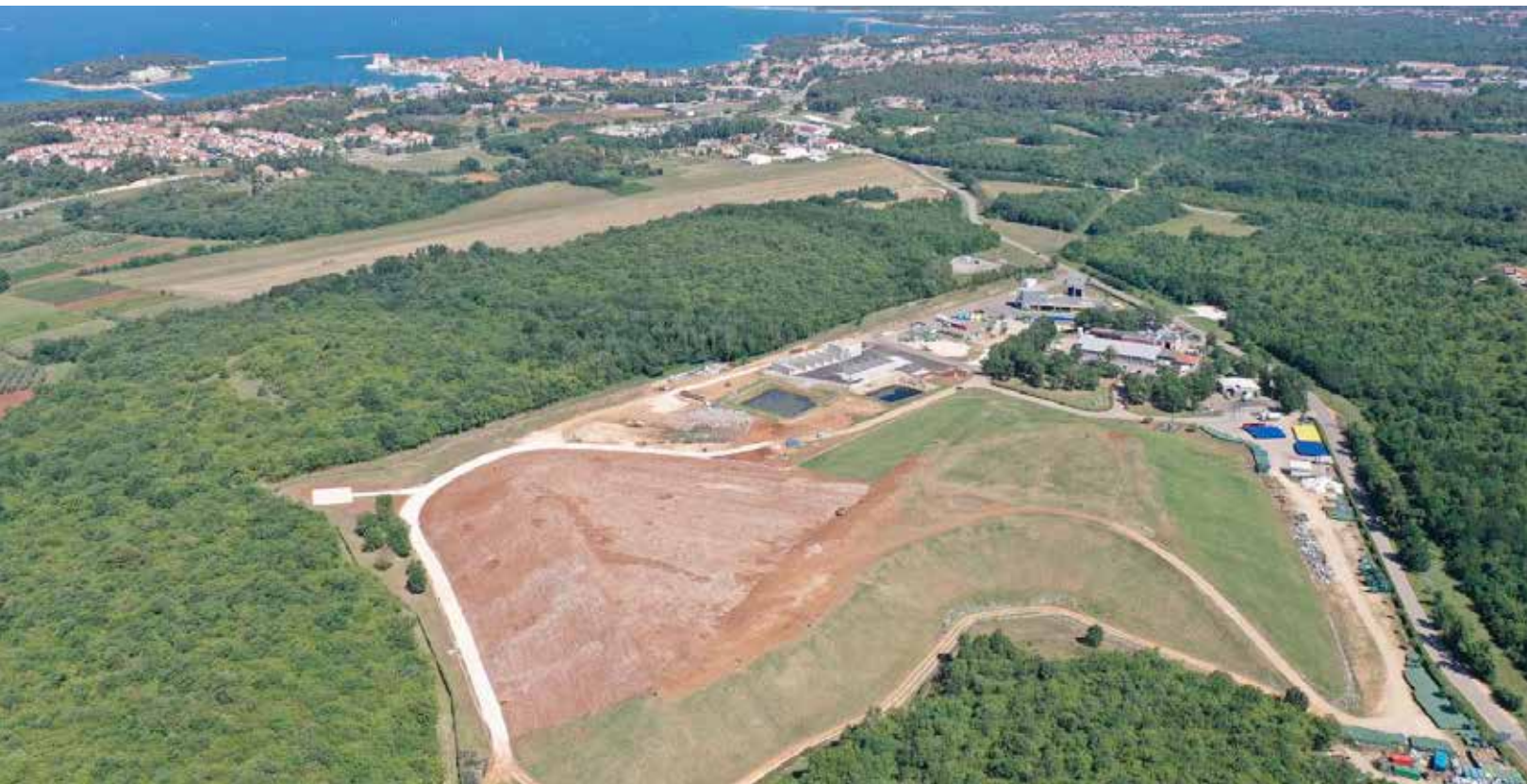
SANIRANO ODLAGALIŠTE OTPADA KOŠAMBRA I IZGRAĐENO RECIKLAŽNO DVORIŠTE