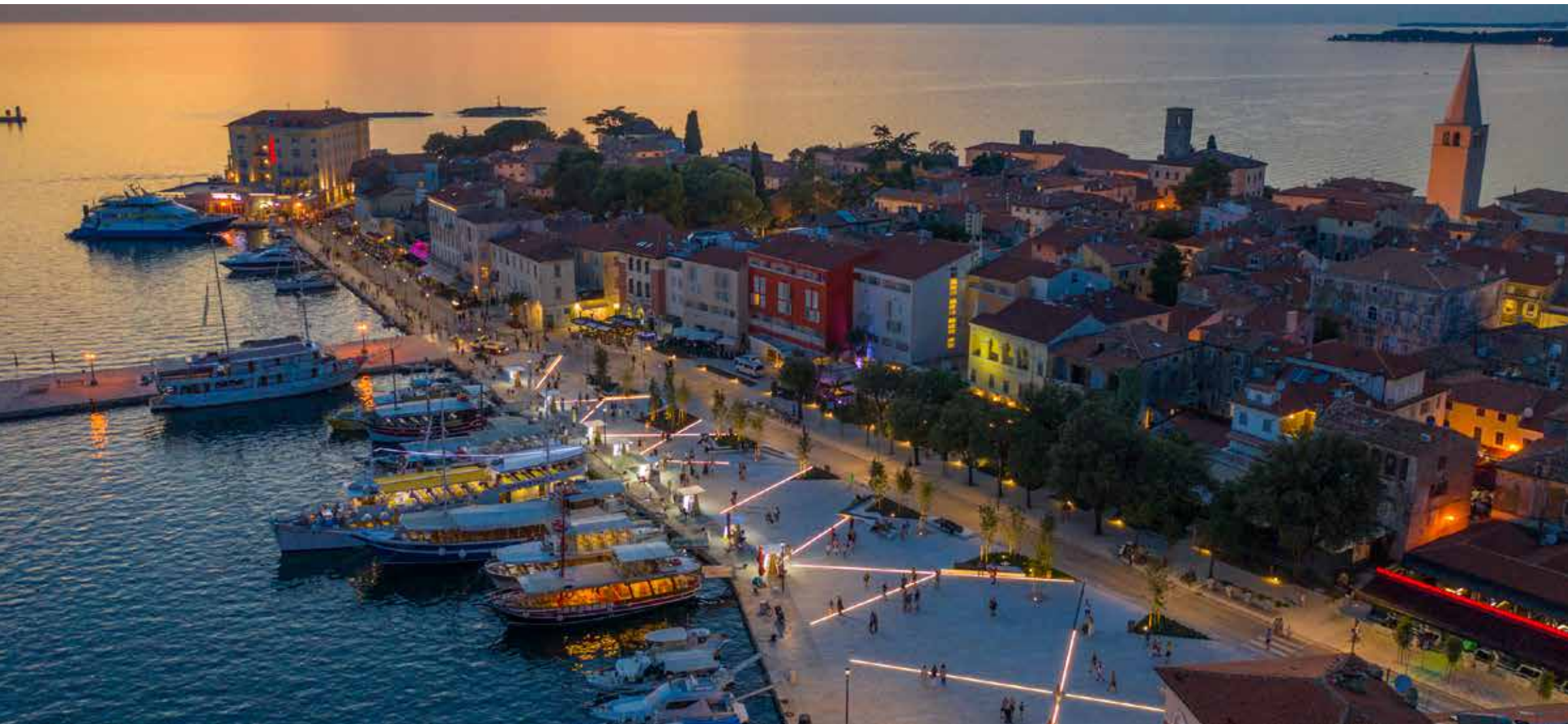
UREĐENJE GRADSKJE RIVE